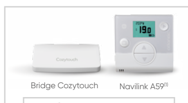
Bridge Cozytouch Navilink A59 (1)

Pilotez, contrôlez et gérez votre confort thermique et eau chaude sanitaire à distance via un smartphone ou une tablette. Visualisez vos consommations d'énergie et activez le mode absence où que vous soyez.